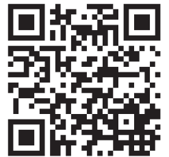
ミスひまわりコンテスト 公式サイト

申し込みをされた方には、8月21日・24日の一次審査(面接)及び説明会の受付時刻が書かれたご案内を封書にてお送りいたしますので、必ずご確認下さい。